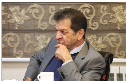
در حرفه یک گسست تاریخی داریم