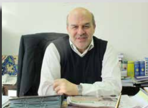
ناقوس خطر برای تمدن ایران به صدا درآمده است