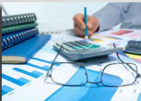
نمونه صورت‌های مالی اساسی طبق استانداردهای بین‌المللی