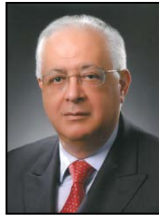
یادمان نصرااله مختار