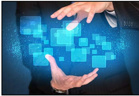
ادغام مؤسسات حسابرسی در ایران