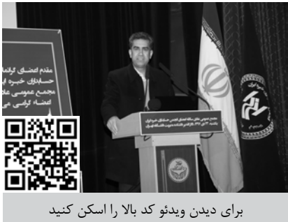
برای دیدن ویدئو کد بالا را اسکن کنید

اطلاعات و دنیای اقتصاد به عنوان روزنامه‌های کثیرالانتشار برای انتشار آگهی‌های انجمن تعیین شدند.