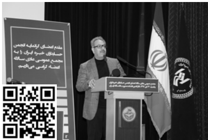
برای دیدن ویدئو کد بالا را اسکن کنید