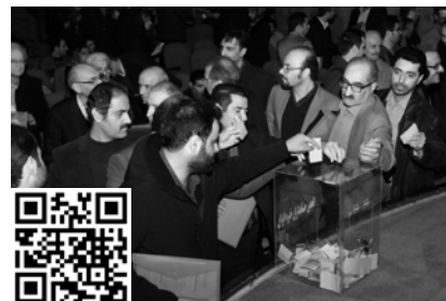
برای دیدن ویدئو کد بالا را اسکن کنید