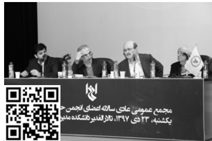
برای دیدن ویدئو کد بالا را اسکن کنید

شرکت‌های نرم‌افزاری آرین سیستم، الگوریتم پویا و طرح‌اندیشان پویا از برگزاری این گردهمایی حمایت مالی کردند و در نمایشگاه جنبی آن به معرفی محصولات و راه‌کارهای نرم‌افزاری خود پرداختند.