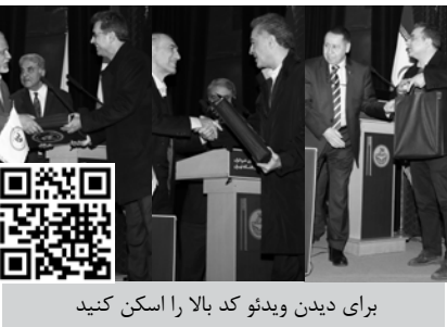
برای دیدن ویدئو کد بالا را اسکن کنید